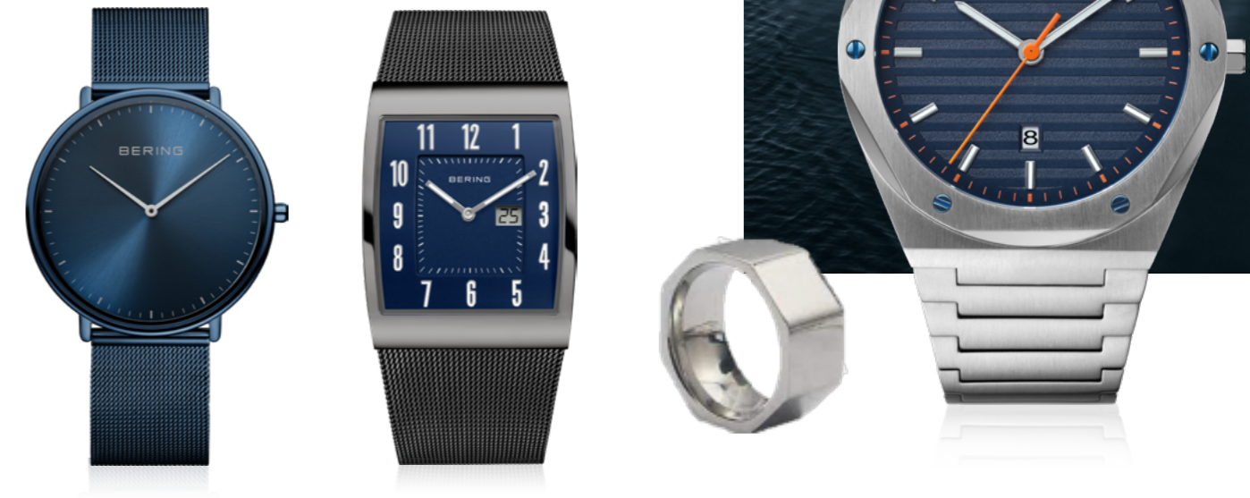
A. Uhr: €199,- | B. Uhr: €169,- | C. Ringkombination: €59,90 | D. Ohrstecker: €39,90 | E. Ringkombination: €109,90 | F. Uhr: €149,- G. Armband: €30,- | H. Charm: €20,- | I. Charm: €29,90 | J. Charm: €20,- | K. Charm: €49,90 | L. Uhr SOLAR: €179,- | M. Kette: €49,- | N. Charm: €49,90 | O. Uhr PEBBLE: €199,- 1 Kratzfestes Saphirglas. 2 Versteckte Gravur innenliegend. 3 Jahre internationale Garantie. Dänisches Design.